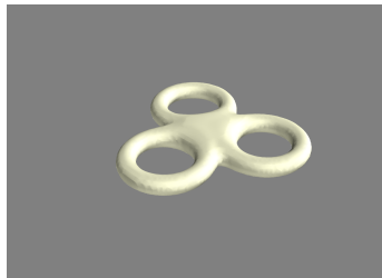
(b) trostruki torus