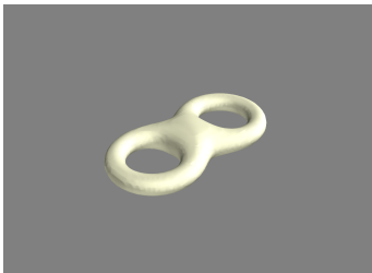
(a) dvostruki torus

i vrijedi b_1 = a \cos \frac{2}{3}\pi , b_2 = a \sin \frac{2}{3}\pi , c_1 = a \cos \frac{4}{3}\pi , c_2 = a \sin \frac{4}{3}\pi za neke odabrane konstante a, c, r, R . Ako promijenimo konstante b_2 i c_2 tako da stavimo b_2 = 0 i c_2 = 0 , dobivamo modificirani trostruki torus.